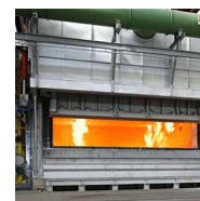
PulsReg ® -Medusa Pulsierendes Regenerativ- Brennersystem

Mehr Informationen unter: www.jasper-gmbh.de