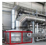
EcoReg ® Drehbett-Regenerator