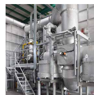
PulsReg ® -Zentral Pulsierendes Regenerativ- Brennersystem