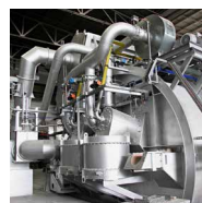
PulsReg ® Regenerativ- Brennersystem